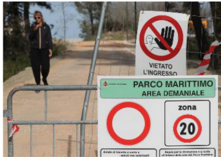
Uno scorcio del cantiere del parco marittimo a Marina di Ravenna